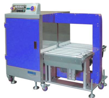
SM 702 YA