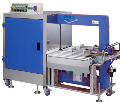
SM 702 YA PRESS AND PUSHER