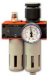
AIR TREATMENT GROUP

Composed by filter, pressure adjustment and lubricator