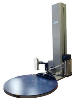
WM 2000 BF 1800