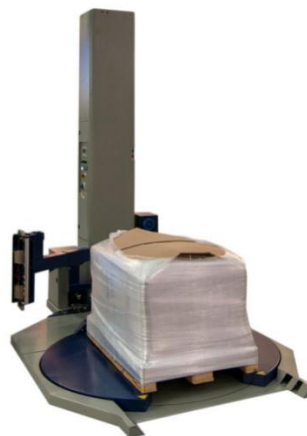
WM 2000 WBF 180°