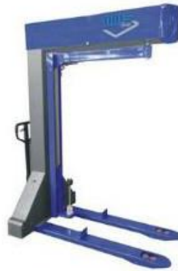
WM 700 A