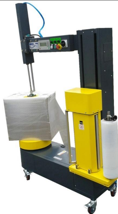
WM 800 B