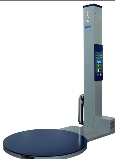
WM 2000 AE