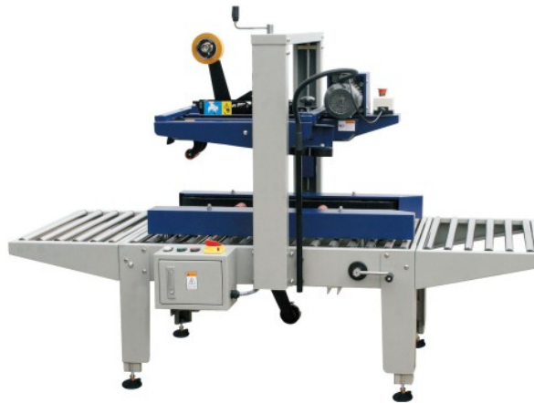
CS MH 1A MINI