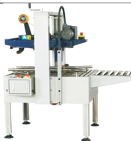
CS 501 D 500