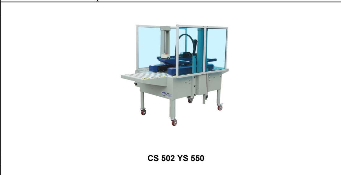
CS 502 YS 550