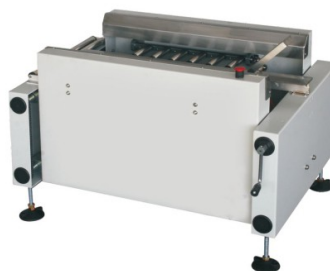
CE 10 TX